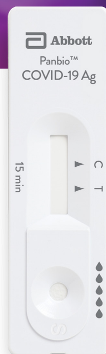
Panbio™ COVID-19 Ag Rapid Test Device